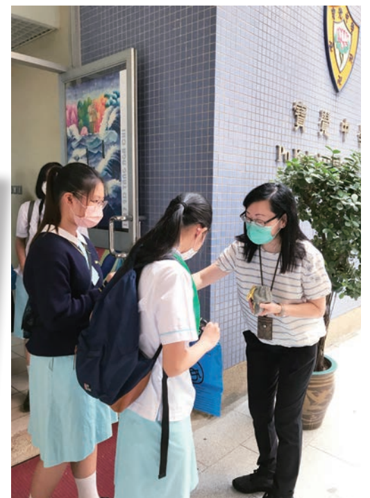
校長買旗支持活動