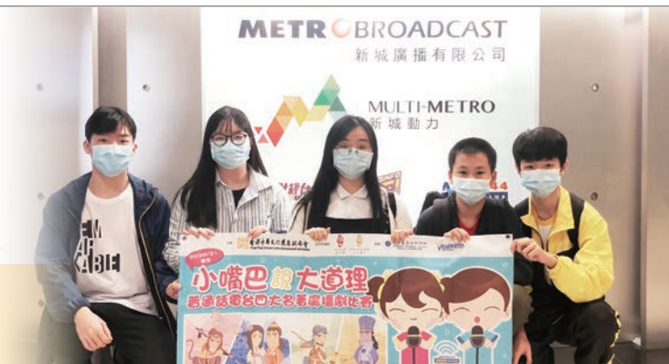
同學到新城電台進行廣播劇錄音