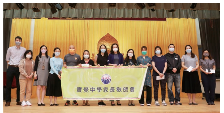
第 20 屆執行委員就職禮大合照