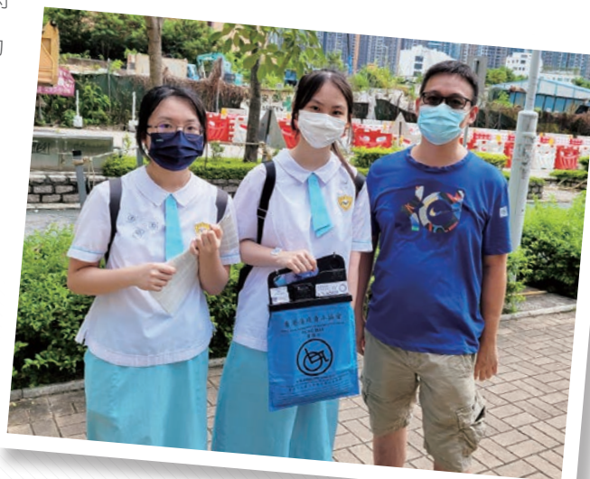
熱心街坊向同學買旗

因此，有天走在路上，假如看見一些滿有誠意地學習著賣旗的學生，不妨主動對他們說：「同學，今天是哪個機構賣旗？我幫你買支旗，好嗎？」不棄小善，開啟一天滿滿的正能量，這不就是慈悲博愛？