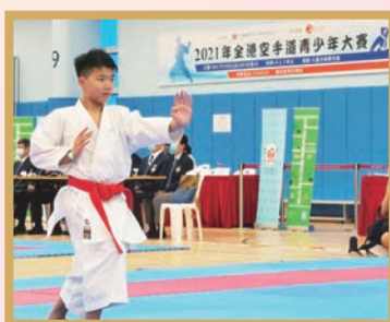
空手道小將的英姿