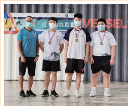
三項「拉」機挑戰賽獲獎同學