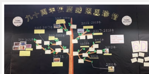
高中組冠軍：六愛班主題壁報