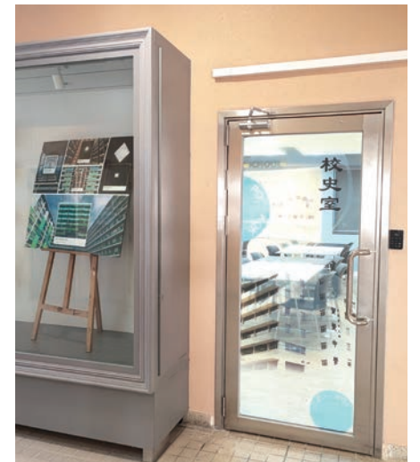
校史室獲優質教育基金資助建設，於十二月開幕。