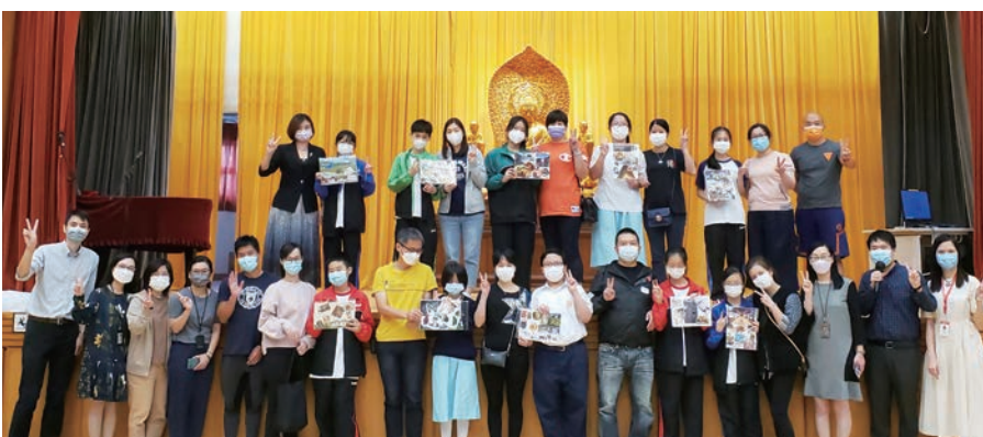
親子合作，心靈拼貼。