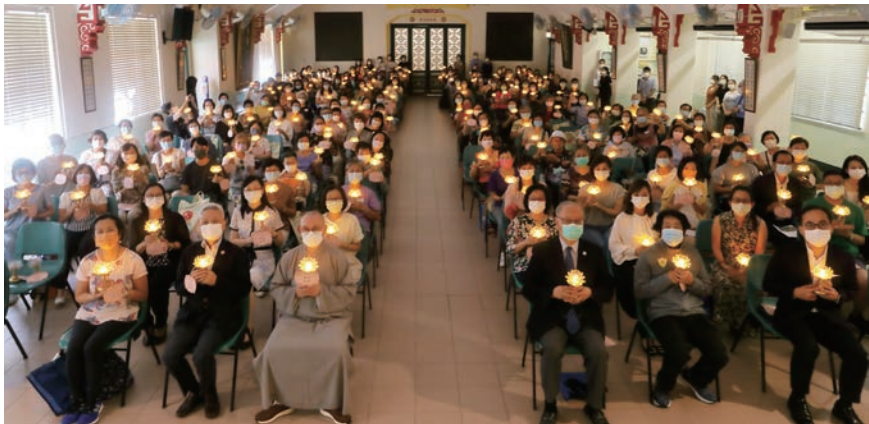
校友共聚，薪火相傳。

為慶祝九十周年校慶及加強校友與學校的聯繫，本校辦學團體東蓮覺苑聯同寶覺校友會、寶覺小學校友會及元朗寶覺小學校友會，舉辦「東蓮覺苑辦學九十周年校友重聚日」。活動在7月10日假跑馬地山光道寶覺小學舉行，該處亦是本校前身寶覺女子中學的校舍所在，當天共有近二百位校友及榮休或離職老師參與活動，既有早在1960年代畢業的校友，也有剛在去年畢業的，大家聚首一堂，暢敘當年情和分享生活近況，樂也融融。