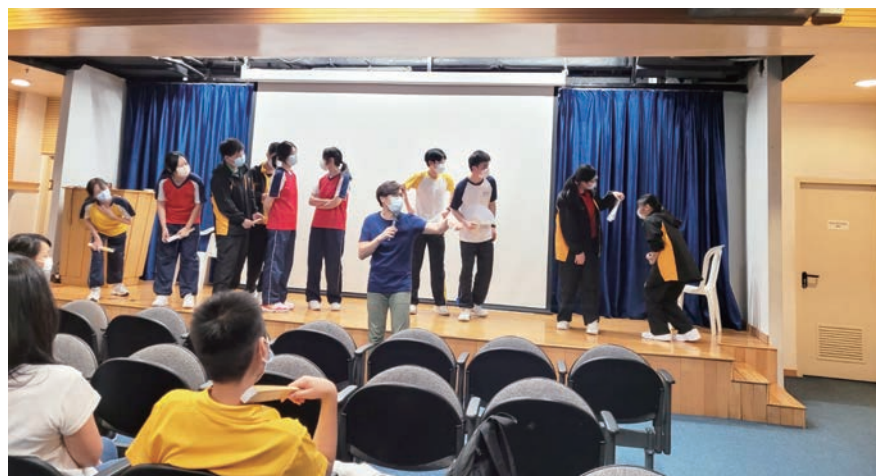
與友校同學合作說書

本校高中同學在上學年參加賽馬會「戲說文言」文言文戲劇教育計劃。該計劃通過戲劇的形式，提升同學閱讀文言文篇章的能力，並舉辦「文言說書大使」工作坊，教導同學以說書演繹經典篇章，然後在課堂及校內表演。在七月初，本校的文言說書大使參與該計劃的跨校進階培訓日營，與友校同學進行互動學習，交流切磋，進一步提升閱讀文言文的能力和說書技巧。通過這些活動，同學的語文能力、表演技巧都有所提升，也加深對中國傳統文化的認識。