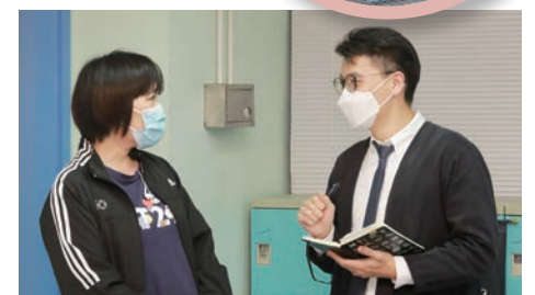
家長、老師熱烈傾談