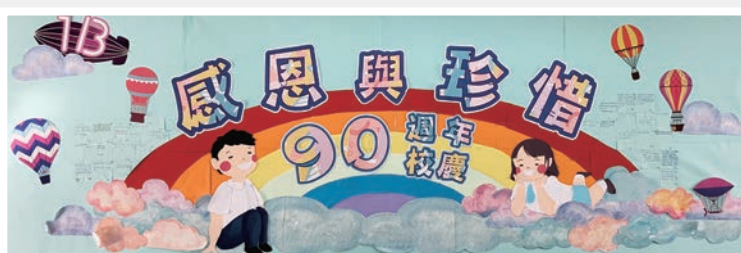
初中組冠軍：一善班主題壁報