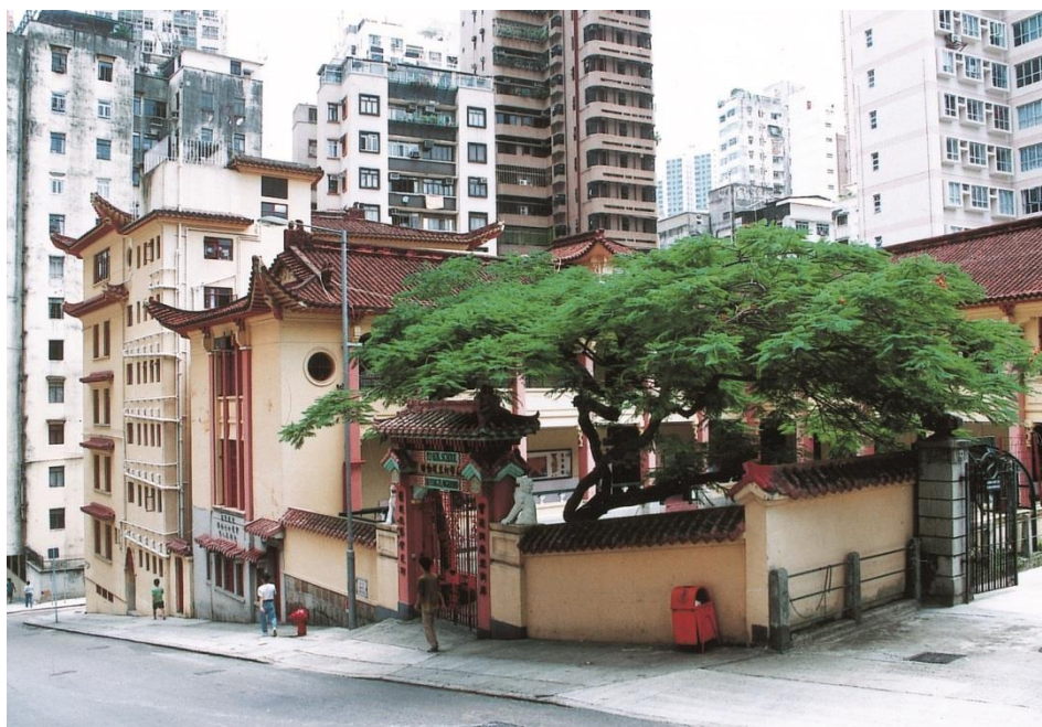
蕭校董眼中的「皇宮」——寶覺女子職業中學暨附屬小學

「學校球場中，有盪鞦韆的設備，又有『瀟』滑梯，附近又有兩棵好大的樹，可以遮蔭，而大門的鐵閘是紅色的，令我感覺是一個很開心的環境。當時我們穿的校服也很特別，這一點都不難適應，但如果你想讀書的話，就一定要學習去適應學校。」