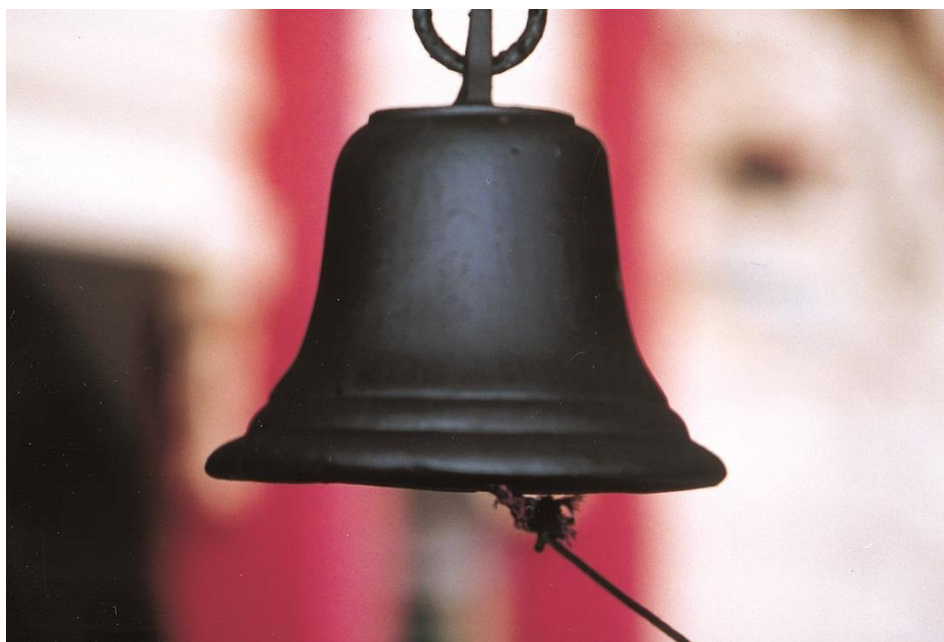
寶覺小學獨有的鐘聲

關懷學生，可說是寶覺辦學一直秉承的精神，但學生也相應地須建立自理精神，至少擁有懂得照顧自己的責任感；尊敬師長，自我反省，也是學生應有的基本價值觀。