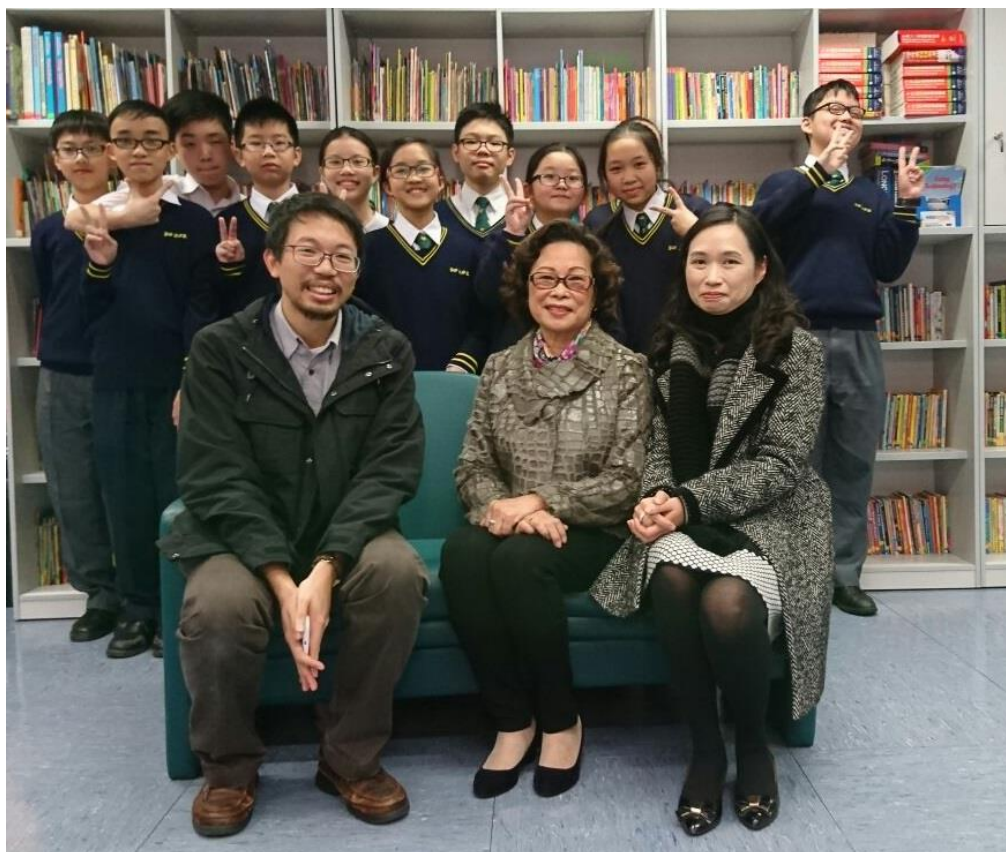
訪問當天，校史工作坊成員與蕭校董合照