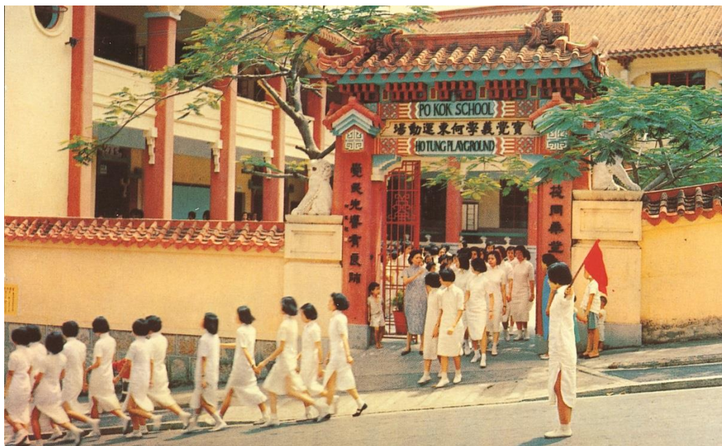
寶覺學生的特色——有禮、守規

以上種種事例，現在聽起來可能會覺得過時，但為何時代好像進步了，但這些有禮、守規、互勵互勉的優點，越來越難在現今的學生中找到呢？